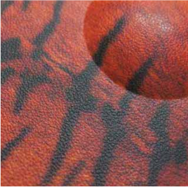
Transformed Plastic / 성형 플라스틱