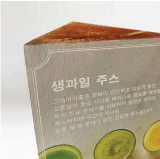
Wood / 나무류