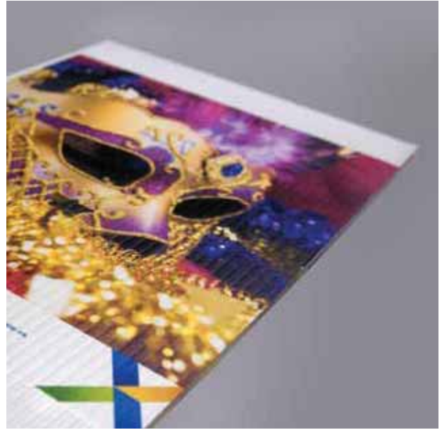
Coroplast / 플라스틱 골판지