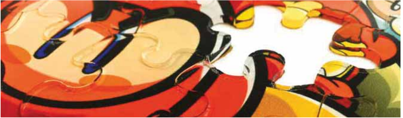
Acrylic / 아크릴