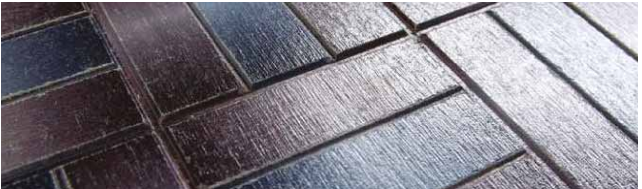
Tiles / 타일