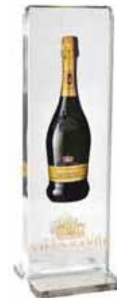
Glass / 유리류

* Adhesion to more unusual materials, such as plastics can be achieved with a Primer after adequate surface treatment.